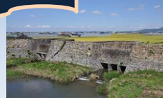
上 旧玉名干拓施設(玉名市) 下 菊池溪谷(菊池市)