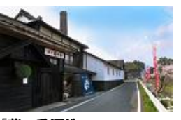
「花の香酒造」 蔵元見学(有料)ができます。